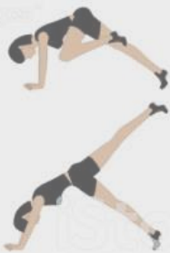
High Donkey Kicks