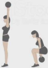
Two-Arm Kettlebell Swing