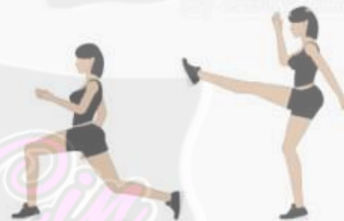
Lunge / Front Kicks